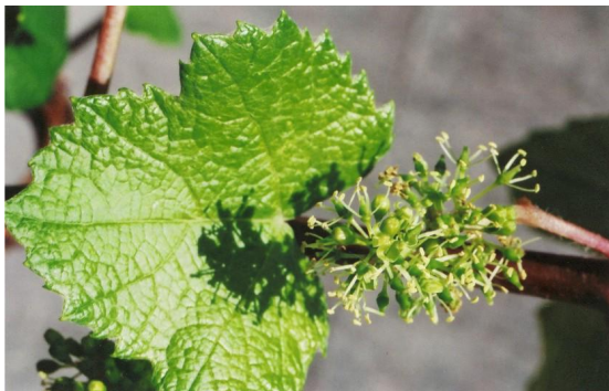
Essência Vibracional 32. Vine

A Indústria e Comércio Florais de Bach Brasileiro L.t.d.a, surgiu em 2005, com a proposta de produzir as 38 essências dos Florais do Dr. Edward, de maneira tradicional, seguindo rigorosamente os métodos ensinados pelo Pai da Terapia Floral, Dr Edward Bach (1886-1936). Utilizando plantas silvestres floridas no Brasil, que estabelecem uma correspondência vibracional, semelhante ao primeiro Sistema Floral descoberto no mundo.